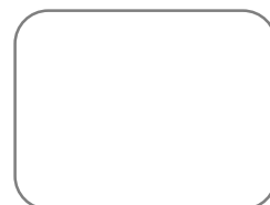
šifra č. 5

(Na výrobu sekerky se používaly tzv. kadluby. Jednalo se o formy, do kterých se nalil roztažený bronz.)