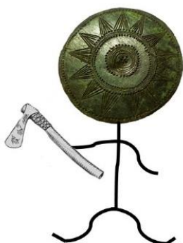
Místo pro nakreslení sekerky

Jedním z používaných nástrojů doby bronzové byla sekerka. Pečlivě si je prohlédněte a zkuste vymyslet, jak je lidé doby bronzové vyráběli.