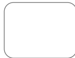
šifra č. 3

3. Pozorně si prohlédněte model těžby rud v pravěku. Zkuste popsat, jakým způsobem lidé rudu těžili?