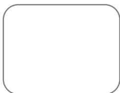
šifra č. 10

10. A jsme na konci cesty.. Poslední šifru naleznete mezi archeologickými střepy v pískovišti. Tak s chutí do toho!